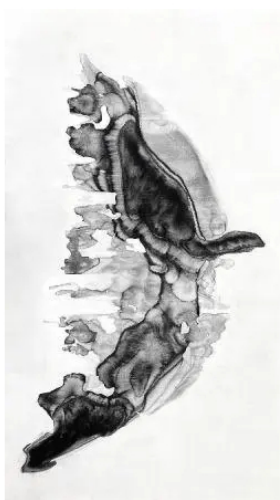
Nakajima Hiroyuki, Moon6 – 210x122 - Chinese ink on canvas

Il 9 ottobre, ai Bagni misteriosi del Teatro Franco Parenti a Milano, inaugura "Scritto nella Pietra", una settimana dedicata all'arte calligrafica dell'Asia orientale: una grande mostra con oltre 50 opere di Morioka Shizue, Nakajima Hiroyuki e Bruno Riva, performance, conferenze e seminari a cura di Katia Bagnoli e Bruno Riva promossa da Comitato Le Cinque Pietre e Associazione culturale shodo.ch con www.shodo.it , il primo sito sulla calligrafia sino-giapponese in Italia. La mostra e il ricco programma di eventi saranno l'occasione per indagare in chiave contemporanea le meravigliose scritte incise sulla pietra, sui carapaci delle tartarughe e fuse nei bronzi rituali che hanno segnato l'inizio di un percorso millenario di scrittura e di arte calligrafica. Morioka Shizue, Nakajima Hiroyuki e Bruno Riva, artisti che da anni lavorano con la calligrafia e la sigillografia, saranno i protagonisti di questo viaggio che intreccia culture e linguaggi, l'antico e il contemporaneo, seguendo le tracce della presenza dell'uomo sulla Terra, che si è manifestata in molte parti del mondo nei segni incisi sulle rocce.