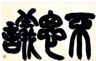
Bruno Riva - Fushigi - 2023-7

"Scritto nella pietra" presenta, attraverso le voci di tre artisti calligrafi molto diversi tra loro, alcune espressioni della calligrafia più contemporanea che illustrano la sua transizione dal segno, petroglifo e pittogramma, alla scrittura, e all'arte. Saranno esposte circa 50 opere realizzate per la mostra utilizzando esclusivamente le scritture più antiche. I tre artisti hanno creato opere di grande e grandissimo formato (da 1 x 1,5 metri a 1 x 14 metri) progettate appositamente per le sale Testori, Mosaico e Zenitale (oltre 350 mq espositivi) della Palazzina dei Bagni Misteriosi del Teatro Franco Parenti. Cervi e pesci,